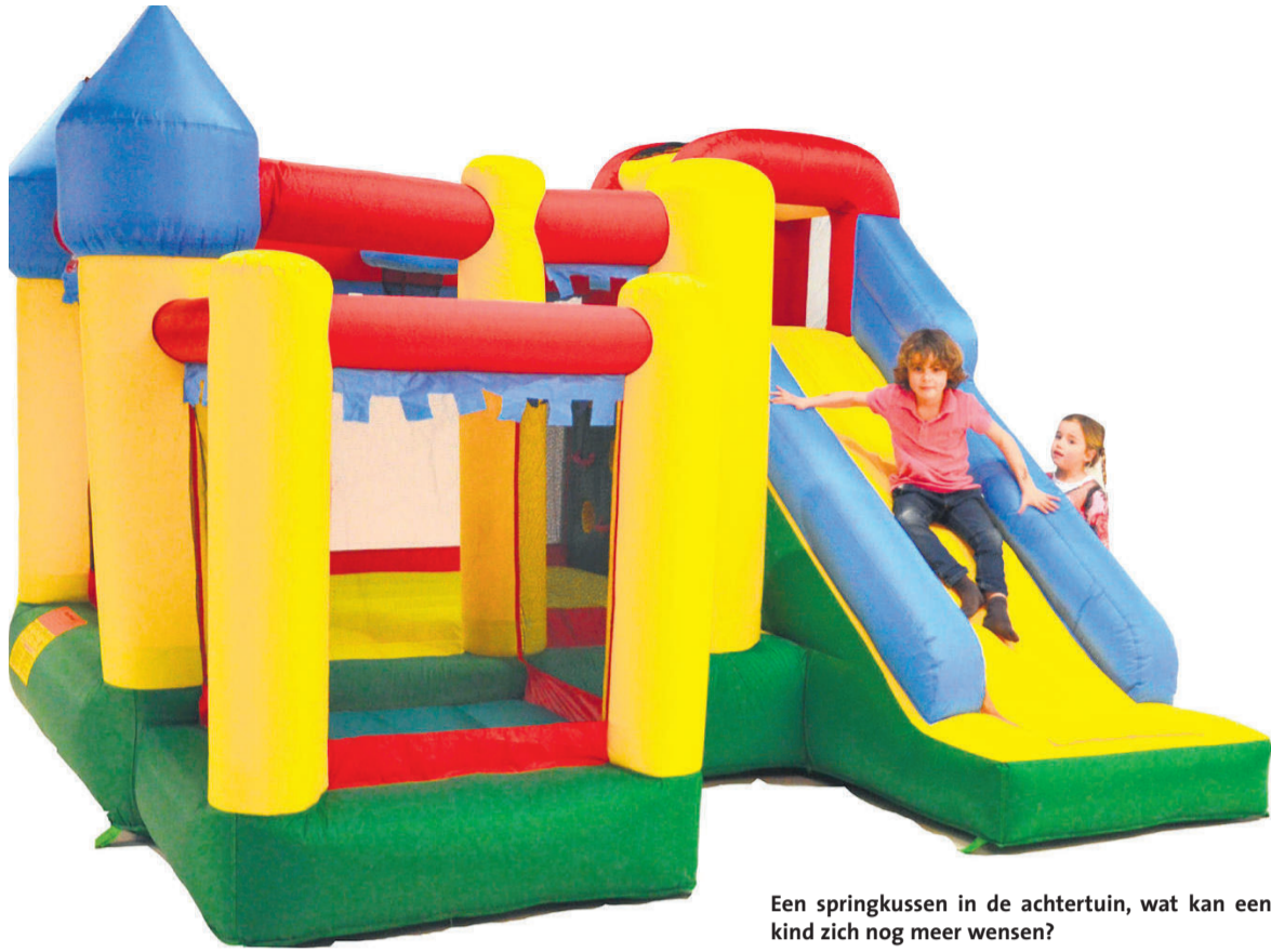
Een springkussen in de achtertuin, wat kan een kind zich nog meer wensen?